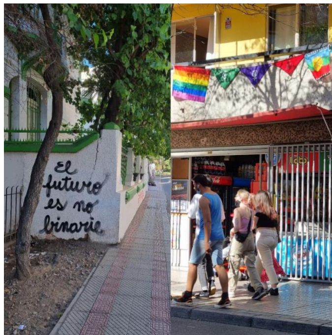
Figura 2: Elaboración propia.

Según Lindón (2008), los espacios abiertos y amplios también se pueden relacionar a libertad, aventura e incluso atracción, como es el caso de parques, plazas y espacios como el centro cultural Gabriela Mistral (GAM) y el barrio Lastarria. Estos lugares poseen una gran diversidad cultural, debido a la convergencia de personas de distintos sectores dado el alto interés turístico, donde se manifiestan diferentes expresiones de género, culturas, estatus sociales, entre otros. Esto va acompañado de elementos que reconocen dicha diversidad, como por ejemplo incorporar banderas de grupos vulnerados a modo de manifestar su apoyo a estos colectivos o la utilización de lenguaje inclusivo (Ver figura 2).