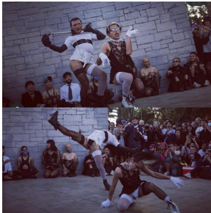
Figura 3: Elaboración propia.

Otro lugar con gran significado para las personas de la comunidad LGBTQ+ y por ende para las personas trans no binarias es el Parque Bustamante en donde se realizan eventos llamados Kiki balls representando la cultura Ballroom y Voguing (Ver figura 3). El Ballroom surge en Estados Unidos por parte de jóvenes que fueron expulsados por su familia por su identidad u orientación sexual. Acá surge la cultura de casa en donde hay una persona que cumple el rol de madre y es quien resguarda al resto de las personas de la casa. Por otro lado, el Voguing es un estilo de baile que forma parte de la cultura ballroom . Las Kiki balls son eventos propios de la cultura ballroom en donde cada casa compite en categorías tales como: Runway, baby vogue, face, sex siren, hands performance, floor performance (Shock, 2021).