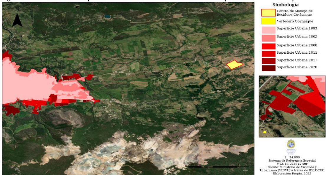
Figura 4. Evolución de expansión urbana Ciudad La Serena – Coquimbo entre 1993 y 2020

Por su parte, la ciudad de Coyhaique presenta un crecimiento urbano orientado a la zona este, sobre todo entre 2006 y 2011, lo que redujo la distancia entre la zona urbana y el antiguo vertedero municipal. El crecimiento urbano de esta ciudad se debe comprender desde su contexto regional; autores explican que este aumento de concentración urbana desde 1992 se debe a la “migración de población desde zonas o centros urbanos y rurales de menor rango o jerarquía, de la comuna, de la región y de otras regiones del país, hacia la ciudad de Coyhaique” (Azócar et. Al., 2010: 87).