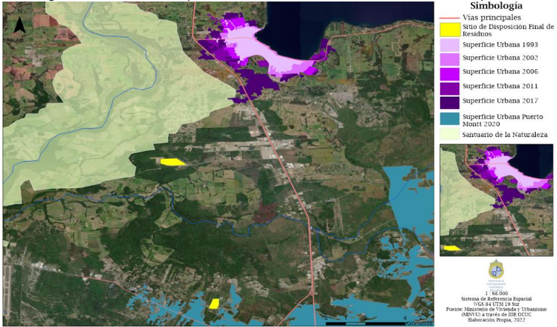
Figura 3. Evolución de expansión urbana Ciudad Puerto Varas entre 1993 y 2017