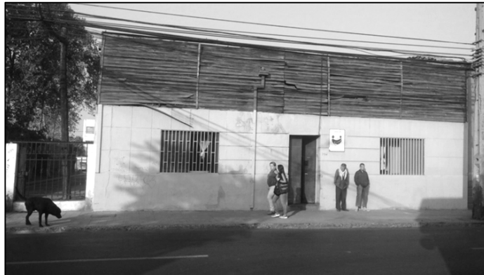
Archivo fotográfico de los autores, abril de 2015.

Entonces, a partir del párrafo anterior se puede apuntar a la perspectiva de Bachellard (1958) citado en Aguilar (2012), del dentro y el fuera, como lo constituye la dinámica interna y externa del habitar el espacio de las personas en situación de calle, que representa un dinamismo de entrada y salida que confluye en un lenguaje único de este contexto. Como se evidencia en la presencia del sujeto en la puerta de la casa, porque establece el límite del espacio del dentro y el fuera “el hombre de casa existe en los dos lados, tanto en el recogimiento en la intimidad del hogar como en la salida al espacio exterior; abriéndose y cerrándose” (Bachellard 1958; Aguilar, 2010: pág. 110).